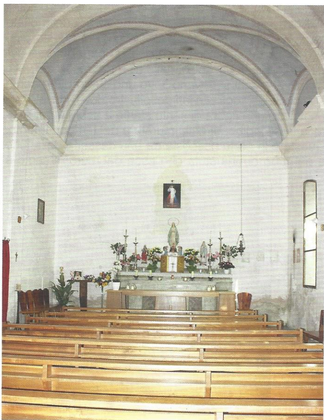
L'interno della chiesa