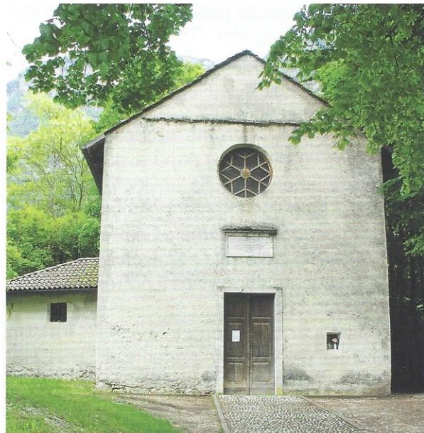
La facciata della chiesa di San Silvestro